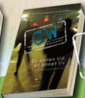
Leif GW Persson En annen tid et annet liv