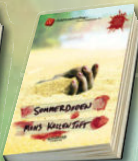
Mons Kallentoft Sommerdøden