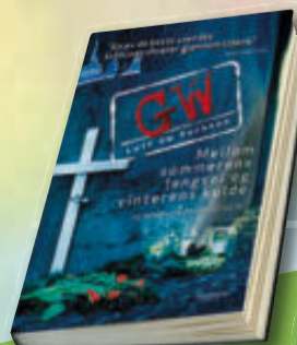
Leif GW Persson Mellom sommerens lengsel og vinterens kulde